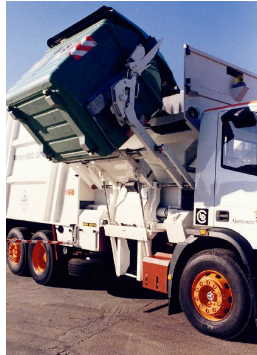
Camió de recollida de càrrega lateral

Pels escombriaires, a més a més, la containerització suposa la remodelació de la plantilla: els camions grans, que duen 1 conductor i 4 peons per fer la feina, passen a dur un conductor i 2 peons. També els camions mitjans, que duen 3 peons, passen igualment a 2. Els treballadors, en una època en què grans empreses fan fallida o processen acomiadaments massius, temen el pitjor. La Cooperativa, però, aconsegueix ampliar els recorreguts i reestructurar els horaris i pràcticament tothom és recol·locat.