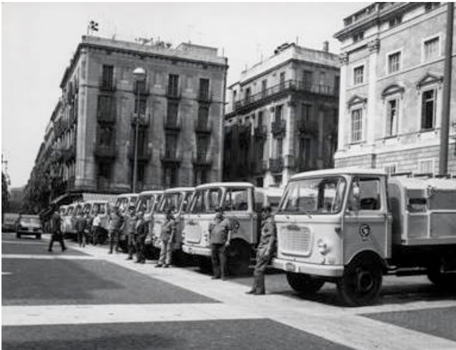
Presentació vehicles lleugers a Sant Jaume

Una de les primeres adquisicions, aleshores, és, finalment, un nou local social: el 1971 la Cooperativa adquireix una planta als emblemàtics edificis Trade de Barcelona, de l'arquitecte Josep Maria Coderch, a la Gran Via Carles III. El disseny innovador i la proximitat reflecteixen l'orientació de la Cooperativa.