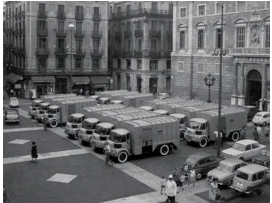
Presentacions de vehicles a la Plaça Sant Jaume

En la mateixa línia de modernitzar les instal·lacions i optimitzar els resultats, el 1965 es decideix vendre el solar del carrer 26 de Gener i comprar una premsa moderna. Era, aquest solar, una compra feta als anys 50 pensant en construir un edifici social. Però el projecte s'havia aparcat quan es va començar a negociar el contracte amb l'ajuntament, perquè es va entendre que seria més necessari invertir en els camions demanats que no pas en els locals socials. El 1965, aleshores, quan ja es disposa d'un local al carrer Parthenon, els socis veuen que els