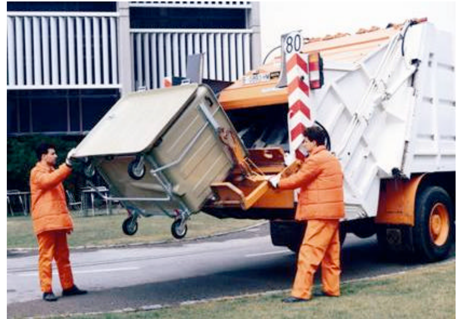
Primers contenidors instal·lats al 1982

Aquest fet suposa un important canvi en els hàbits de la gent. La brossa deixa de recollir-se casa per casa, dins un horari molt determinat i, els ciutadans topen amb els contenidors, no només visualment sinó, també alguns, físicament: hi ha qui els mou i els canvi de lloc per poder aparcar el seu cotxe, o bé els torna inaccessibles aparcant-hi just davant.